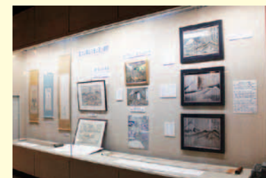
▲宝永噴火に関する絵図や古図など