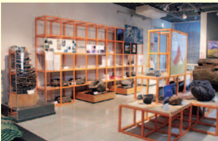
▲火山弾と溶岩樹型