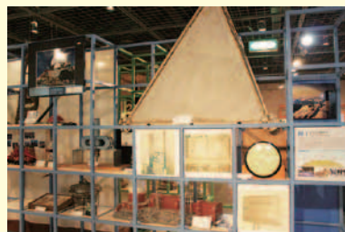
▲富士山測候所に関する展示