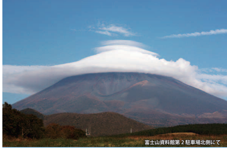
富士山資料館第2駐車場北側にて